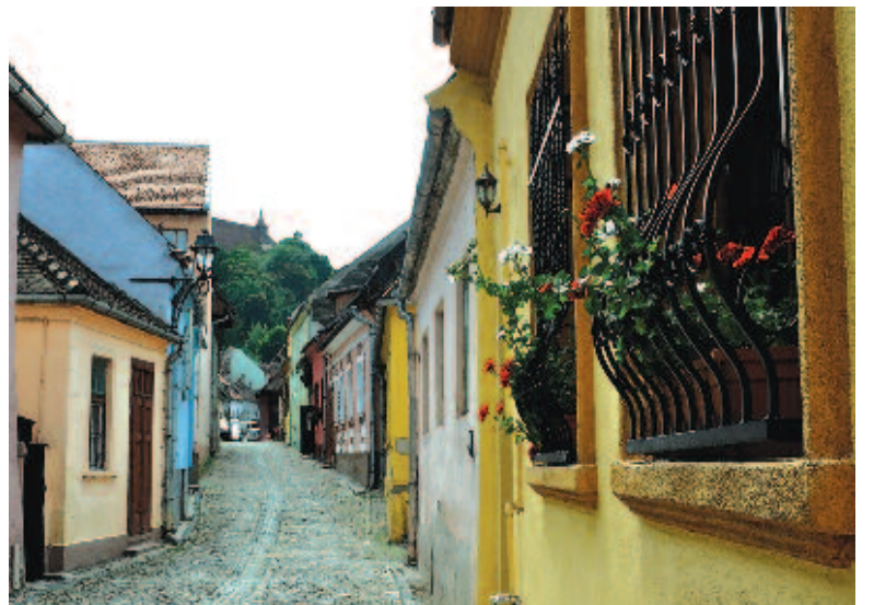
Utcarészlet a várbán