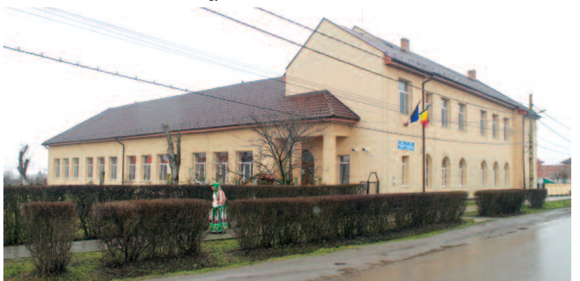
A maroskeresztúri iskola

– Mi azért nem adjuk fel, újra és újra megszólítjuk a maroskeresztúriakat – jegyezte meg a polgármester.