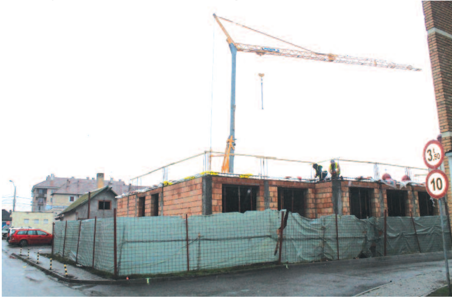
Maroskeresztúri vendégházunk a 6. oldalon