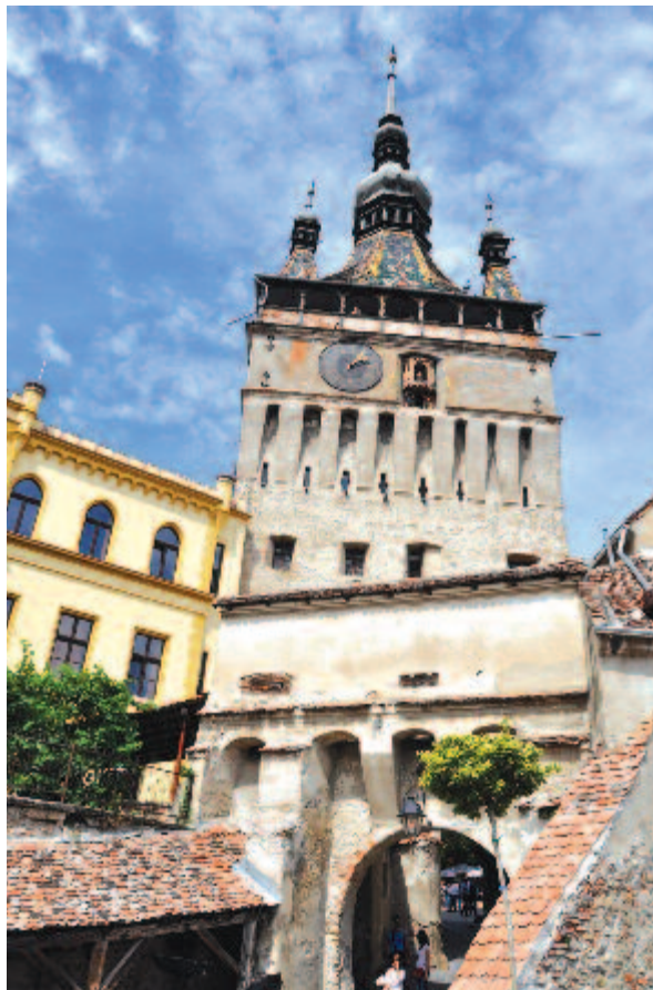
Segesvár szimbóluma, az Óratorony

A kolostortemplommal szemben található a Venecei ház , amelyet a XVI. században építettek. Nevét a venecei gót stílust utánozó ablakairól kapta. Ebben lakott Stephanus Mann, a város egykori polgármestere. Jelenleg az épületben a Német Fórum és egy turisztikai információs központ működik. Ezzel szemben áll a Drakula-ház , amely XIV. században épült, és a legrégebbi civil épület. Valamikor a várórség tulajdonában áll, utána pedig középkori vendégházként is működött. Állítólag II. Dracul, a Sárkányrend lovagja 1431–1436 között Segesváron tartózkodott, arra várva, hogy visszafoglalja a törököktől Havasalföldöt, és trónra kerüljön. Itt született 1431-ben fia, Vlad, aki később elnyerte a karóba húzó „Țepeș” nevet. Az ő legendás történeteiből ihletődött Bram Stoker