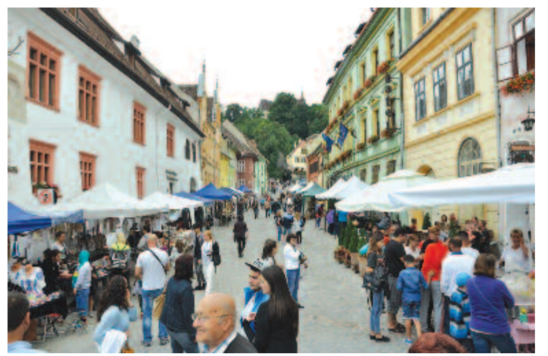
A segesvári vár a Pro Ethnica fesztivál idején

A reformáció idején a város szász lakossága mind lutheránus lett, a domonkosoknak el kellett hagyniuk a várost. Mindkét templom, a kolostortemplom és a hegyi templom is a lutheránusoké lett. A katolikus hitélet újrarendülése 1702-től kezdődött,