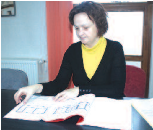
Elkészült az iskolabővítés terve

Ami az idei év közösségi eseményeit illeti, a tervek szerint két fon-